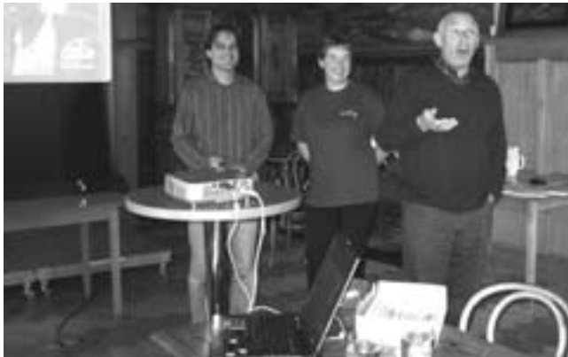
Vortrag Wohnen im Alter

Der Vorstand des Kneippvereins wünscht euch eine besinnliche Weihnachtszeit und Alles Gute im Neuen Jahr – Glück, Gesundheit und Zufriedenheit.