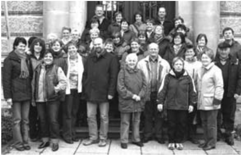
Ausflug zum Weihnachtsmarkt in Augsburg

Wir danken unseren Mitgliedern für die rege Teilnahme an unseren Veranstaltungen.