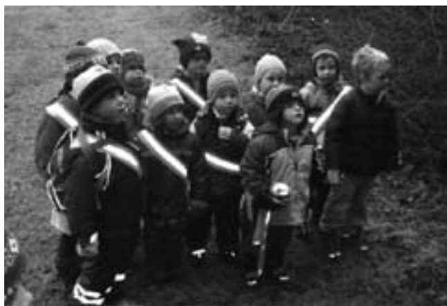
Die Kinder bestaunen den Nikolaus!

Gib uns zum Säckchen drum dazu die schönste deiner Gaben, dass wir die Menschen, so wie du, von Herzen lieb auch haben.