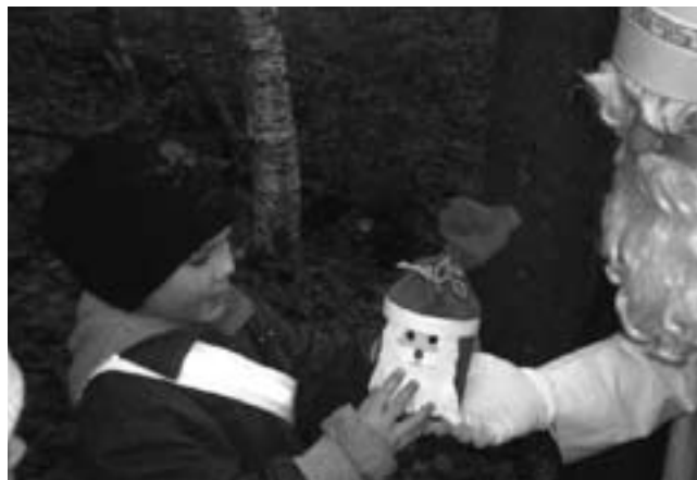
Mit Freude nahmen die Kinder das Nikolausgeschenk entgegen.