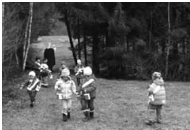
Leider musste der Nikolaus schon wieder weiter.

Bei einem Spaziergang ins Schollamoos trafen einige Kinder den Nikolaus. Für die anderen Kinder hatte er im Kindergarten eine kleine Gabe hinterlassen. Die Freude und Begeisterung über den Besuch des Nikolaus war groß!